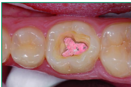
Abb. 4: Situation nach Wurzelfüllung eines kariös stark ausgehöhlten unteren ersten Molaren. Zur Wiederherstellung der Kaufunktion sollen adhäsive Restaurationswerkstoffe eingesetzt werden: ein fließfähiges Komposit als Unterfüllung und die stopfbare Materialvariante für die okklusale Deckfüllung. Aufgrund der kritischen Mundhygiene des jungen Patienten wird auf ein besonders widerstandsfähiges und mundbeständiges Kunststoff-Füllungsmaterial wie Nano-Hybrid-Komposit auf Dimer-Säure-Basis zurückgegriffen.

Die verbesserten werkstoffkundlichen Charakteristika beruhen insbesondere auf