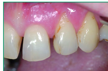
Abb. 6: Klinische Ausgangssituation einer erforderlichen restaurativen Neuversorgung an Zahn 21 und Zahn 22, bedingt durch die bestehenden insuffizienten Füllungen. Die Wahl fiel auf direkte adhäsive Kompositfüllungen. Als Restaurationswerkstoff wurde N'Durance ausgesucht. Die innovative Chemie der organischen Kunstharz-Matrix (Nano-Dimer Conversion Technology) und die damit verbundenen positiven mechanisch-werkstoffkundlichen Charakteristika machen dieses Füllungsmaterial zu einem vielversprechenden Werkstoff der restaurativen Zahnheilkunde im Rahmen der Adhäsiv-Technik.

meisten Komposit-Füllungsmaterialien liegen hier bei Werten von nur 45 bis maximal 65 Prozent!