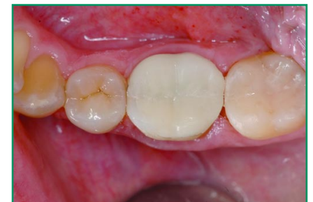
Abb. 3: Die abgeschlossene großflächige Aufbaufüllung aus einem hoch viskosen Komposit auf der werkstoffkundlichen Basis der Nano-Dimer-Konversionstechnologie am ersten Molaren. Gerade bei derartigen Restaurationen, die nahezu die gesamte klinische Zahnkrone umfassen, sind adhäsive Füllungswerkstoffe gefragt, die keine werkstoffkundlichen Nachteile aufweisen und nicht nur „Schön-Wetter-Komposite“ darstellen. – Die Kavität in der mesio-lingualen Approximallfläche des zweiten Molaren wurde ebenfalls mit einem Nano-Dimer-Konversions-Komposit, hier speziell mit der fließfähigen Variante, gefüllt.