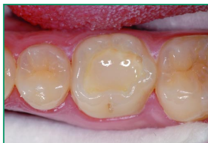
Abb. 5: Die ausgeprägte Fließfähigkeit und der deutliche Chamäleoneffekt von N'Durance Dimer Flow machen es zu einem guten Restaurationsmaterial für alle Einsatzbereiche niedrig-visköser Komposite (hier als Unterfüllung). Darüber hinaus erlauben die werkstoffkundlichen Materialcharakteristika auch Verwendungen zur langfristigen Zahnerhaltung in klinisch stark beanspruchten wie auch mundhygienisch kritischen Arealen.