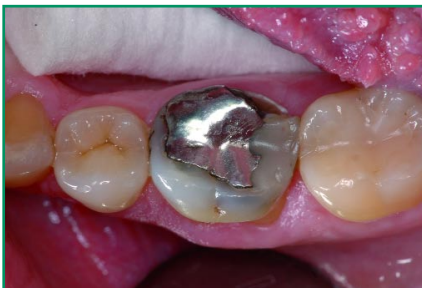
Abb. 1: Klinischer Eingangsbefund eines unteren ersten Molaren mit einer gebrochenen Amalgamfüllung, einer alten Komposit-Reparaturfüllung (disto-okklusale) und einem kariesbedingten Abbruch der disto-lingualen Zahnschubstanz; der zweite Molar weist eine Klasse-I-Kompositfüllung auf und zeigt röntgenologisch im mesio-lingualen Approximallbereich eine Kariesläsion.