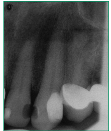
Abb. 9: Zahn 13 nach der vorsorglichen Aufbaufüllung mit N'Durance . Die außerordentliche Röntgenopazität dieses Nano-Hybrid-Komposits beruht auf einer optimierten Kombination von Ytterbiumfluorid-Nanopartikeln und Nanoclustern, Bariumglas und Siliziumoxid.

lungsmaterial-System dar. Die modifizierte Kunstharzmatrix auf Dimer-Säure-Basis, in Kombination mit der technologischen Möglichkeit der Polymerisationsinduzierten Phasenseparation (PIPS), eröffnet zusätzliche Vorteile bei der Erzielung langlebiger Füllungsversorgungen.