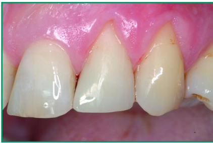
Abb. 7: Die fertigen Restaurationen direkt nach Abschluss des Füllvorgangs; die hier im Mittelpunkt stehende Versorgung des Zahns 22 wurde mit der Flow-Variante des Komposits als Unterfüllung und der hoch-viskösen Masse aus der Standard-Kartuschen-Spritze (beide im Farbton A2) bewerkstelligt. Die sehr guten ästhetischen Eigenschaften und die ebenso gute Polierbarkeit dieses Restaurationswerkstoffs sind augenfällig. Die vom Hersteller hervorgehobene Biokompatibilität des Füllungsmaterials ist ein weiterer, nicht zu vernachlässigender Pluspunkt dieses Kompositmaterials.