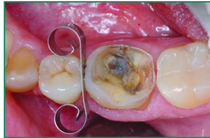
Abb. 2: Orientierende Zwischenansicht der beiden Molaren vor der Fortsetzung der Dentinwundbehandlung und der restaurativen Füllungsversorgung; der erste Molar lässt nach Entfernung der alten Füllungen noch weitere zu behandelnde Schäden erkennen. Die Karies im inneren, mesio-lingualen Anteil des zweiten Molaren wurde soweit wie möglich ohne unnötige Abtragung der okklusalen Zahnschubstanz entfernt.