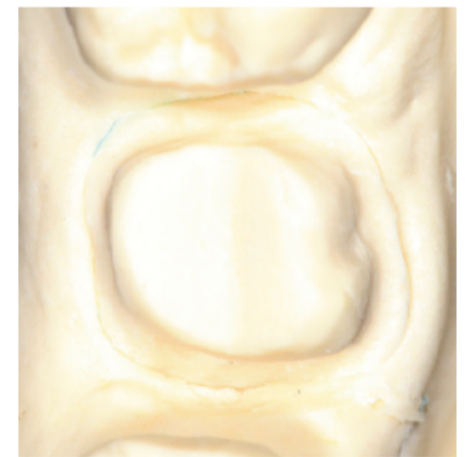
Und sind auf dem Gipsmodell sichtbar.