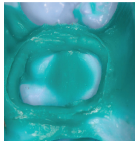
Alle Ränder und subgingivalen Details werden perfekt wiedergegeben.