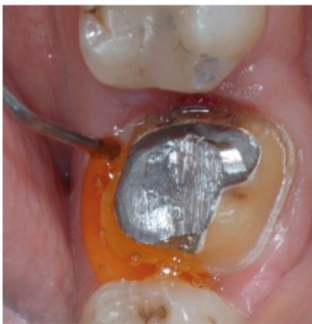
Racegel um die Präparation in den Sulkus applizieren und 2 Min. wirken lassen.