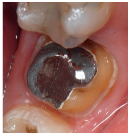
Gründlich abspülen und die Abformung durchführen.